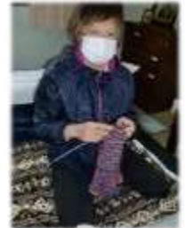
編み物編んで誰への プレゼント??