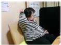
のんびりリラ〜ックス