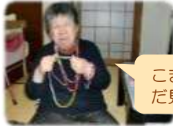
ビーズアクセサリー作り