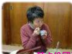
花より団子! ご飯より… デザート!!