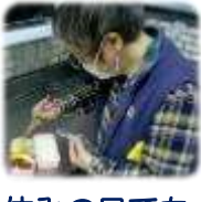
休みの日でも たまにはお弁当を作ります。